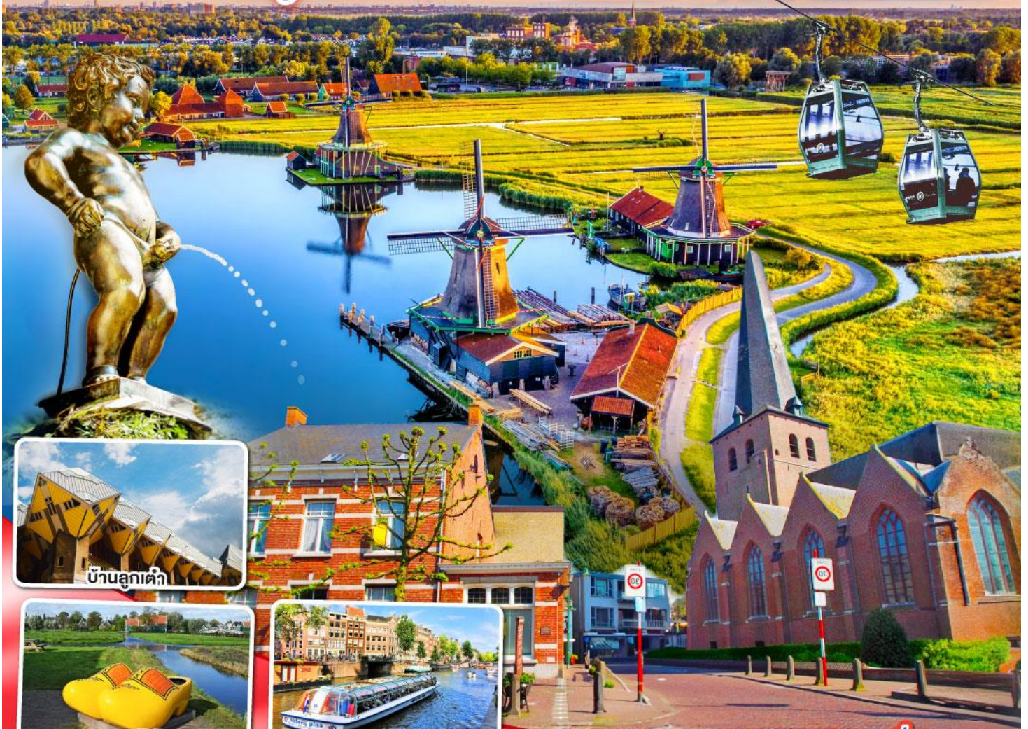
บ้านลูกเต๋า

นามูร์ ดินองต์ บารส์-นัสซา บารส์-เฮร์ตโก