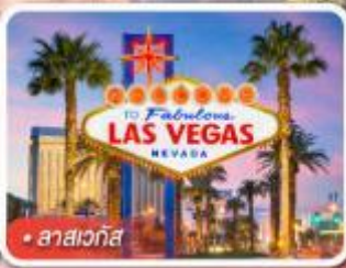
ลาสเวกัส