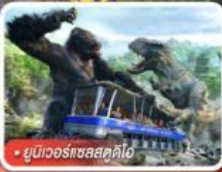
ยูนิเวอร์แซลสตูดิโอ