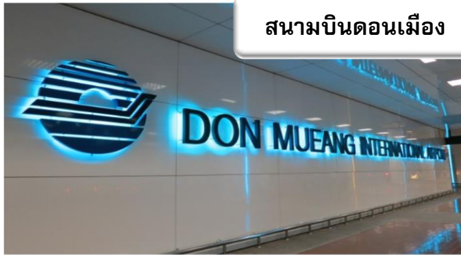
สนามบินดอนเมือง

เวลา 22.30 น. พร้อมกันที่ ท่าอากาศยานดอนเมือง อาคารผู้โดยสารขาออกระหว่างประเทศ เคาน์เตอร์สายการบินไทยแอร์เอเชีย เจ้าหน้าที่คอยให้การต้อนรับดูแลด้านเอกสาร เช็คอิน และสัมภาระในการเดินทาง