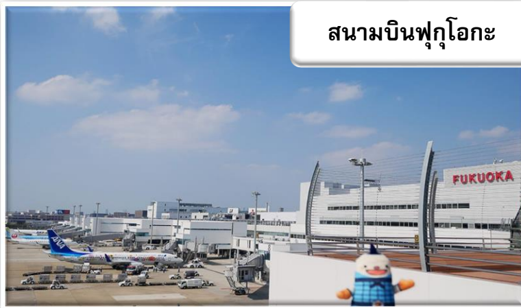
สนามบินฟุกุโอกะ

เวลา 01.45 น. ออกเดินทางสู่ สนามบินฟุกุโอกะ ประเทศญี่ปุ่น โดยสายการบินไทยแอร์เอเชีย เที่ยวบินที่ FD 236