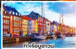
ท่าเรือบูฮาวน์