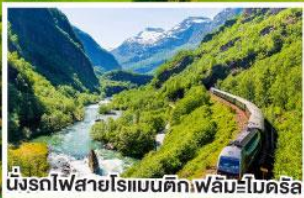
นั่งรถไฟสายโรเมนติกฟิล์มโบคริส