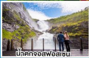
น้ำตกจอสฟอสเซ่น