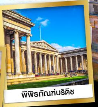
พพิธภัณฑบริติช