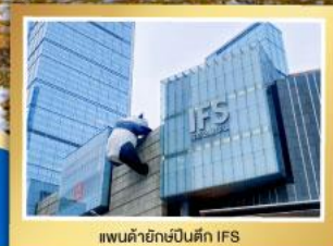
เพนต้าอิกซ์ป็นตึก IFS