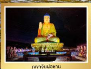
ภูเขาจินฝอซาน