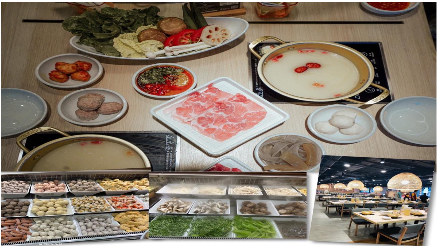
เที่ยง รับประทานอาหารเที่ยง 101 (3) เมนูชาบู