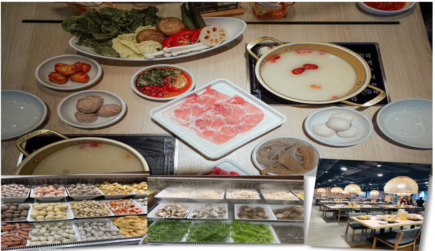
เที่ยง รับประทานอาหารเที่ยง ณ ภัตตาคาร (5) เมนูชาบู