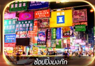
ช้อปปิ้งมังกิก

เต็มอิ่ม ทั้งไข่วพระ-ขอพร การเงิน การงานความรักและช้อปปิ้ง