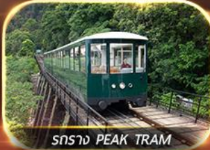
สราง PEAK TRAM