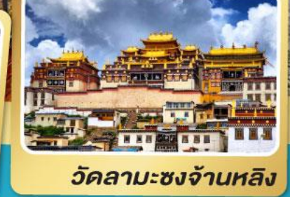
วัดลามะซงจ้านหลิง