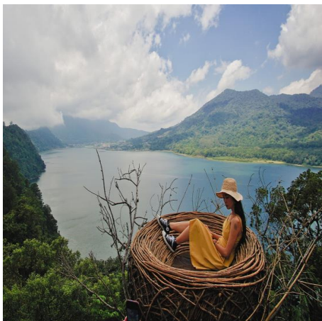
WanagiriHidden Hills Baliสำหรับกิจกรรมการถ่ายภาพ

จากนั้นนำท่านเดินทางสู่ Wanagiri Hidden hill ตั้งอยู่บนทางหลวง Munduk Wanagiri ที่มีความสูงของพื้นที่ภูเขาทางตอนเหนือของเกาะบาหลี เนินเขา และทะเลสาบที่มีความสวยงามเป็นเอกลักษณ์ แหล่งท่องเที่ยวทางธรรมชาติของ ถือเป็นกิจกรรมน่าสนใจที่ซ่อนอยู่ในบาหลี หนึ่งในนั้นคือการท่องเที่ยวทางธรรมชาติที่น่าทึ่งพร้อมเสน่ห์แห่งความงามที่เหมาะสมสำหรับการพักผ่อนและเซลฟีใน Buleleng Wanagiri Hidden Hills Bali นำเสนอจุดถ่ายรูปที่มีคอนเซ็ปต์มีเสน่ห์ของ