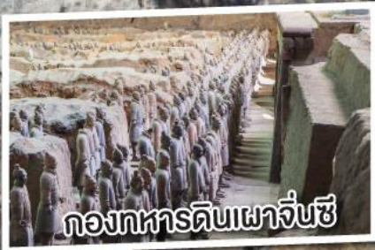
กองทัพดินเผาจิ๋นซี