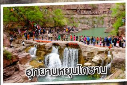
อุทยานหยุนโกซาน