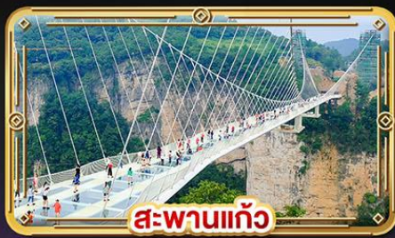
สะพานแก้ว