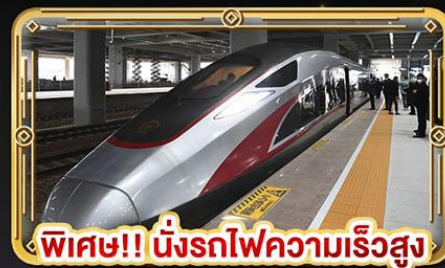
พิเศษ!! นั่งรถไฟความเร็วสูง