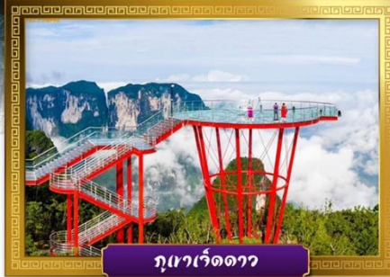
ภูเขาเจ็ดดาว

✓ เดินเล่นถนนคนเดินหวงซิงลู่และซีปู้เจีย