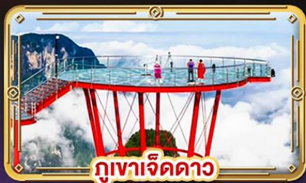
ภูเขาเจ็ดดาว