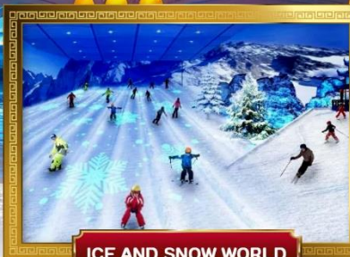
ICE AND SNOW WORLD