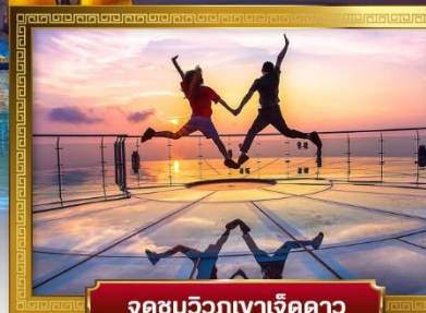
จุดชมวิวกูเขาเจ็ดดาว