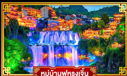
หมู่บ้านฟุรงเจิน