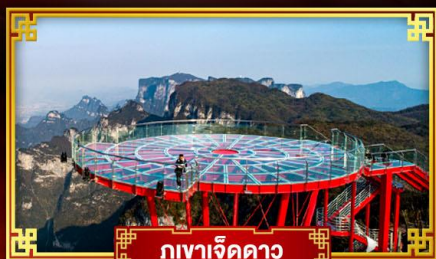
ภูเขาเจ็ดดาว