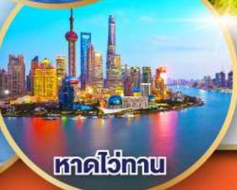
หาดไว่ทาน