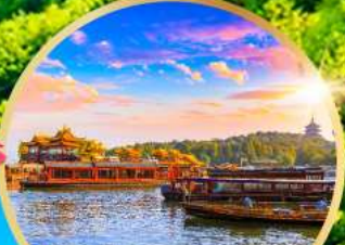
ล่องเรือทะเลสาบซีหู