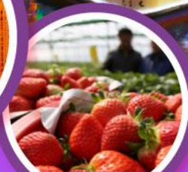
เก็บสตอร์วเบอร์รี่