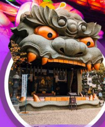
ศาลเจ้านิมบะ ยาชากะ