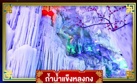
ถ้ำน้ำแข็งหลงกง

"เที่ยว 2 มณฑล กวางซี-ก๊วยโจว" สุดอลังการ น้ำตก 2 פרמადน แลหลังท่องเที่ยวระดับ 5A