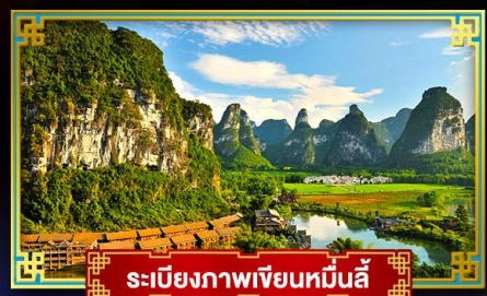
ระเบียบภาพเขียนหมื่นลี้