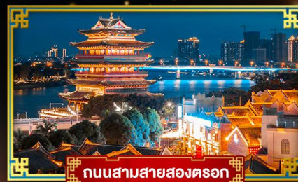
ถนนสามสายสองตลก