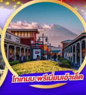
โทเทมบะ-พรีเมียมเอ้าเล็ท

เดินทาง 14-19 ม.ค. 68 21-26 ม.ค. 68 28 ม.ค.-02 ก.พ.68