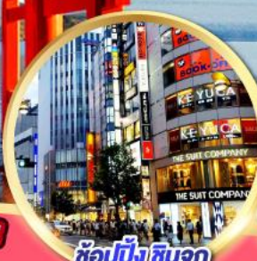
ช้อปปิ้ง ซินจูกุ