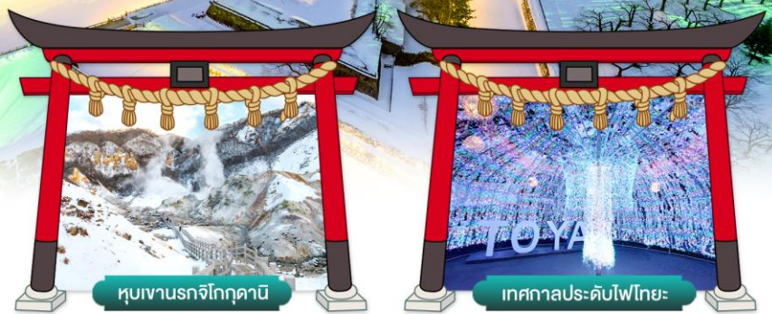
หุบเขานรกจิกุกุดานิ