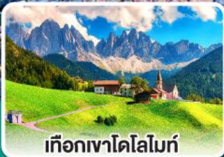
เทือกเขาโดโลไมท์