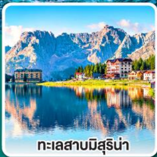
ทะเลสาบมิสุรีน่า

เข้าชมมหาวิหารเซนต์ปีเตอร์ ที่ใหญ่ที่สุดในโลกแห่งนครวาติกัน