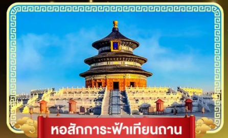
หอสักการะฟ้าเทียนถาน