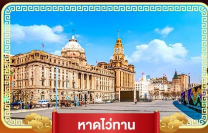
หาดวักาน