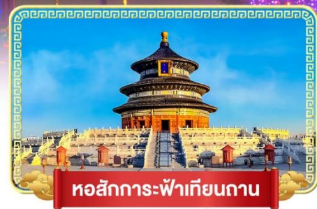
หอสักการะฟ้าเทียนถาน